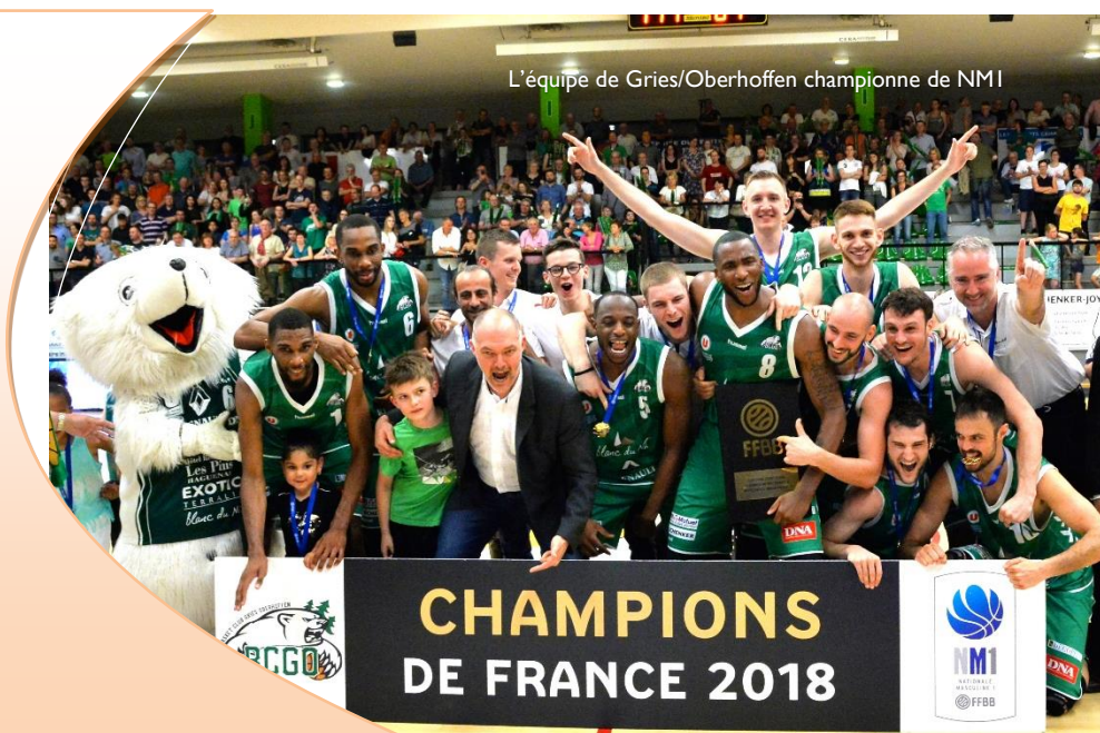
L'équipe de Gries/Oberhoffen championne de NMI