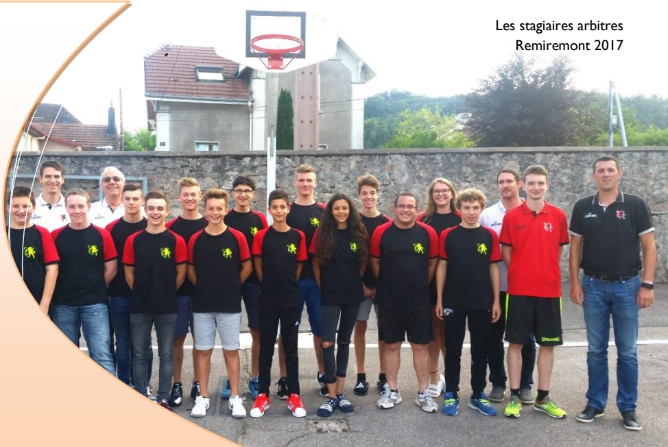
Les stagiaires arbitres Remiremont 2017